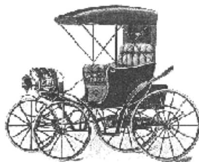
Экипаж Вуда 1902 г.

ПЕРВЫЙ ЭЛЕКТРОМОБИЛЬ В ВИДЕ ТЕЛЕЖКИ С ЭЛЕКТРОМОТОРОМ БЫЛ СОЗДАН В 1841 ГОДУ. ПЕРВЫЙ ДВУХМЕСТНЫЙ ЭЛЕКТРОМОБИЛЬ РУССКОГО ИНЖЕНЕРА-ИЗОБРЕТАТЕЛЯ ИПОЛИТА РОМАНОВА ОБРАЗЦА 1899 ГОДА ИЗМЕНЯЛ СКОРОСТЬ ДВИЖЕНИЯ В ДЕВЯТИ ГРАДАЦИЯХ — ОТ 1,6 КМ В ЧАС ДО МАКСИМАЛЬНОЙ В 37,4 КМ В ЧАС.